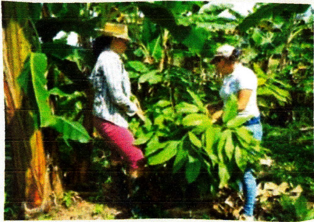
Asistencia técnica con enfoque de equidad de género.

Finalmente, en este evento se analizaron también los servicios que prestan los laboratorios especializados de la FHIA en análisis de suelos, de tejidos foliares y de residuos de plaguicidas, así como el trabajo que hace el SIMPAH (Sistema de Información de Mercados de Productos Agrícolas de Honduras), en el suministro de información de precios de productos e insumos agrícolas en Honduras y Nicaragua. Un aspecto interesante de resaltar es que desde el 2011 la FHIA administra el INFOAGRO (Sistema de Información Agroalimentaria), mediante un convenio con la Secretaría de Agricultura y Ganadería, lo cual ha convertido en estos últimos años a este sistema en el portal informativo del sector agrícola de Honduras.