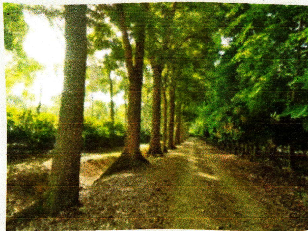
Lindero de caoba en el CEDEC-JAS, La Masica, Atlántida, Honduras, C.A.

También se continuó la evaluación de especies forestales asociadas con el cultivo de cacao en sistemas agroforestales, con datos confiables acumulados de casi 20 años, en los que se está identificando con claridad las especies que mejor funcionan en este asocio en beneficio económico para los productores. Así mismo se avanzó en la evaluación del crecimiento de especies forestales sembradas en linderos.