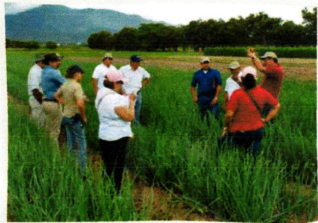
Centenares de productores, técnicos, estudiantes, etc., se capacitan cada año en las instalaciones de la FHIA.