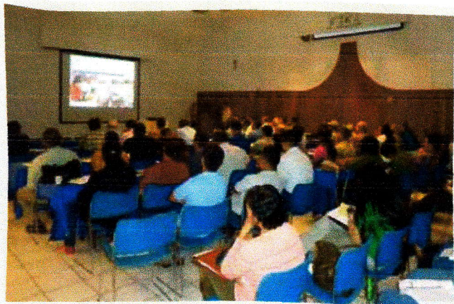
Personal técnico de la FHIA e invitados especiales analizando el trabajo realizado en el 2014.

El Programa de Hortalizas informó sobre los resultados obtenidos en la evaluación de nuevos materiales genéticos de calabacita, repollo y cebollas, lo cual fue complementado con una serie de trabajos de investigación relacionados con el estudio del Psilido de la papa y su relación con la enfermedad de la Papa rayada, así como el efecto de la diversificación del hábitat sobre agentes de control biológico en el cultivo de cundeamor para exportación, en coordinación con el Departamento de Protección Vegetal.