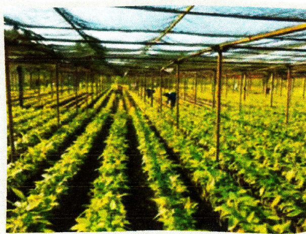
Los viveros de la FHIA producen miles de plantas de alta calidad.

En este evento quedó evidenciada la magnitud del trabajo que realizó en el 2014 el Programa de Cacao y Agroforestería, tanto en actividades de investigación como en servicios de asistencia técnica a centenares de productores en la zona cacaotera del país. En sus dos centros experimentales, el CEDEC-JAS y el CADETH, ambos ubicados en el litoral atlántico de Honduras, se continuó con la evaluación de híbridos seleccionados por la FHIA por su comportamiento productivo, resistencia genética a enfermedades y características de finura, y la evaluación de clones de cacao provenientes del CATIE (Centro Agronómico Tropical de Investigación y Enseñanza). En ambos casos se están obteniendo resultados promisorios.