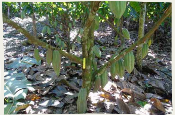
Parcela de cacao en sistema agroforestal de 3 años de establecida en el CADETH.